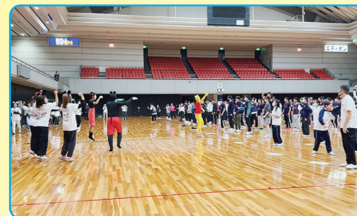
オープニング体操「ジャンボリーミッキー」

(公財)日本レクリエーション協会が認定するレクリエーションの専門資格者を養成する課程認定校(大学・短大・専門学校)は大阪府下に14校あります。「レクリエーション交流大会」は課程認定校が中心となり、実行委員会を組織して開催する、今回で第29回目を迎えるレクリエーションイベントです。令和6年度は11月16日にエディオンアリーナ大阪府立体育会館にて開催しました。今年も、課程認定校の学生だけではなく、「大阪府レクリエーション・コーディネーター会」、「福祉レクリエーションネットワーク大阪」、「大阪府生涯スポーツ・ディレクターの会」にもレクリエーションのブースを設けていただき、学生とレクリエーションのベテランが一堂に集い、レクリエーションを楽しむ時間となりました。