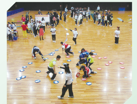
大阪体育大学 教育学部 何ができるかな?オセロワードコレクターズ!!