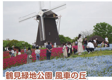
鶴見緑地公園 風車の丘