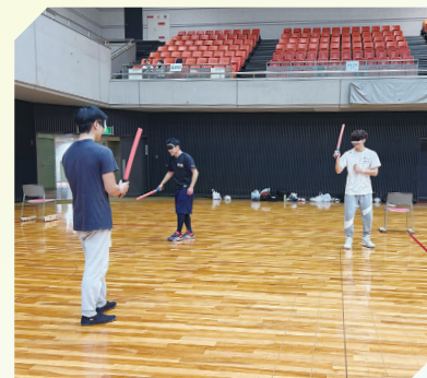
大阪国際大学A 気配切り