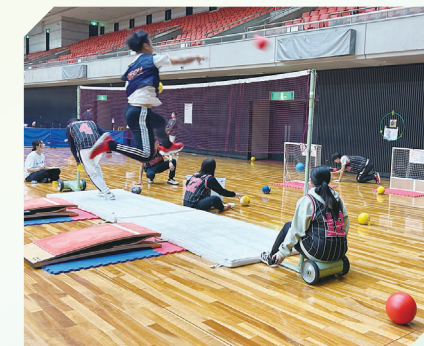
大阪体育大学 教育学部 跳べ!ねらえ!ジャンピングシューター