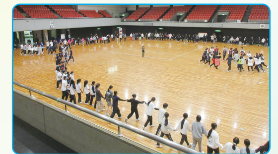
エンディングダンス「マイムマイム」

最も印象に残ったブースは、1位は大阪国際大学Aの「気配切り」(17.8%)、2位は大阪体育大学教育学部の「跳べ!ねらえ!ジャンピングシューター」(17.3%)、3位も大阪体育大学教育学部の「何ができるかな?オセロワードコレクターズ!!」(13.1%)でした。いずれのブースも趣向を凝らした内容で工夫されており、多くの学びと刺激と楽しさと共に交流できた喜びが、参加した皆さんの全身にあふれていました。この大会は学生実行委員による運営で実施され、参加者全員で行う開会式のオープニング体操や閉会式でのエンディングダンスでは、会場が一体となり交流を深めることができました。