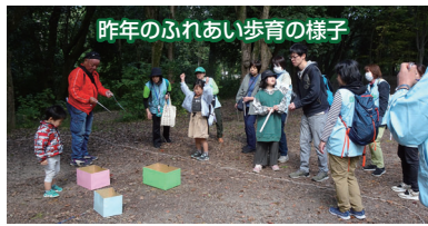
昨年のふれあい歩育の様子