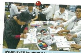
昨年の認知症予防セミナーの様子

お申込み は、公財財団法人大阪府レクリエーション協会まで TEL: 06-6634-1702、FAX: 06-6634-1703 E-mail: sankaka@ora.ecnet.jp、ホームページから いずれかでお申込みください。