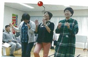
昨年の認知症予防セミナーの様子