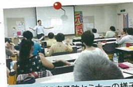
昨年の認知症予防セミナーの様子